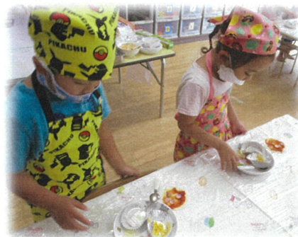
さっそくクッキングスタート