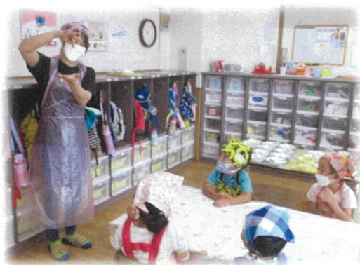
ピザの作り方の説明を聞いています。