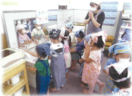
しっかり手洗いをします。